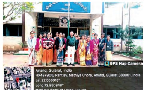
Anand, Gujarat, India HX42+9C6, Rahtlav, Mathiya Chora, Anand, Gujarat 388001, India Lat 22.556018° Long 72.950848°