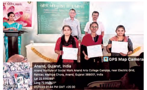
Anand, Gujarat, India Anand Institute of Social Work Anand Arts College Campus, near Electric Grid, Rahtliav, Mathiya Chora, Anand, Gujarat 388001, India Lat 22.556088* Long 72.950921* 01/11/23 01:44 PM GMT +05:30