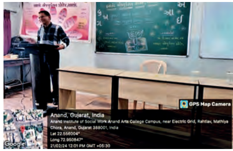
Anand, Gujarat, India Anand Institute of Social Work Anand Arts College Campus, near Electric Grid, Rahtliav, Mathiya Chora, Anand, Gujarat 388001, India Lat 22.556094* Long 72.950947* 21/02/24 12:01 PM GMT +05:30