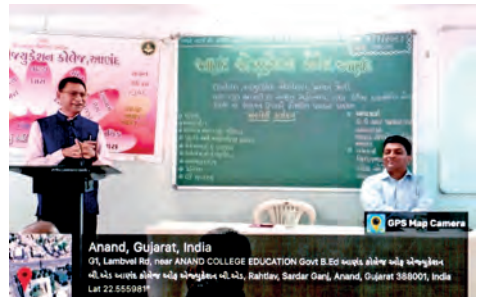
Anand, Gujarat, India G1, Lumbavi Rd, near ANAND COLLEGE EDUCATION Govt B.Ed સર્વેશ સોલેય નીચે ઓફિસ દે.સી. સર્વેશ સોલેય નીચે ઓફિસ દે.સી. Rahtlav, Sardar Gani, Anand, Gujarat 388001, India Lat 22.555981°