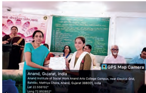
Anand, Gujarat, India Anand Institute of Social Work Anand Arts College Campus, near Electric Grid, Rahtliav, Mathiya Chora, Anand, Gujarat 388001, India Lat 22.556192* Long 72.950852*