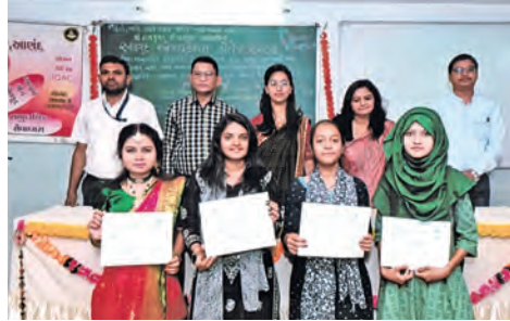
Anand, Gujarat, India Anand Institute of Social Work Anand Arts College Campus, near Electric Grid, Rahtlav, Mathiya Chora, Anand, Gujarat 388001, India Lat 22.556192° Long 72.950852°