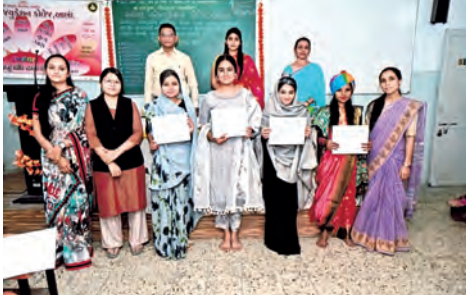
Anand, Gujarat, India Anand Institute of Social Work Anand Arts College Campus, near Electric Grid, Rahtlav, Mathiya Chora, Anand, Gujarat 388001, India Lat 22.556192° Long 72.950852°