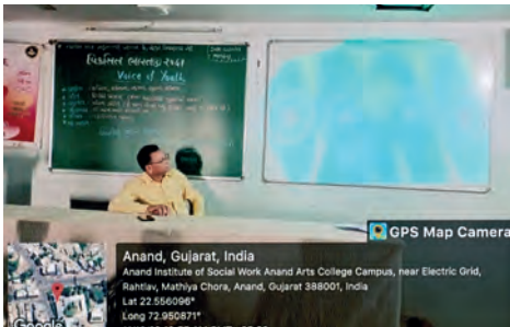
Anand, Gujarat, India Anand Institute of Social Work Anand Arts College Campus, near Electric Grid, Rahtliav, Mathiya Chora, Anand, Gujarat 388001, India Lat 22.556096* Long 72.950871*