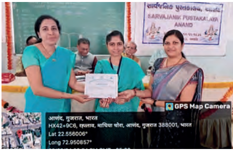
આણંદ, ગુજરાત, ભારત HX42+9C6, રાહતિયા, માધિયા ઘોરા, આણંદ, ગુજરાત 388001, ભારત Lat 22.556006* Long 72.950857*