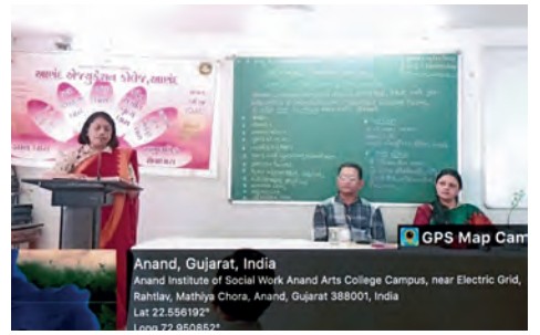
Anand, Gujarat, India Anand Institute of Social Work Anand Arts College Campus, near Electric Grid, Rahtliav, Mathiya Chora, Anand, Gujarat 388001, India Lat 22.556192* Long 72.950852*