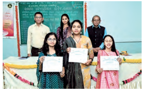
Anand, Gujarat, India Anand Institute of Social Work Anand Arts College Campus, near Electric Grid, Rahtlav, Mathiya Chora, Anand, Gujarat 388001, India Lat 22.556192° Long 72.950852°