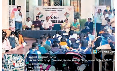
Anand, Gujarat, India SRKSM CAMPUS, opp. Town Hall, Rahtlav, Mathiya Chora, Anand, Gujarat 388001, India Lat 22.556011° Long 72.951177°