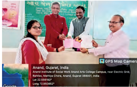
Anand, Gujarat, India Anand Institute of Social Work Anand Arts College Campus, near Electric Grid, Rahtliav, Mathiya Chora, Anand, Gujarat 388001, India Lat 22.556192* Long 72.950852*