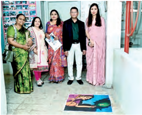
Anand, Gujarat, India Anand Institute of Social Work Anand Arts College Campus, near Electric Grid, Rahtlav, Mathiya Chora, Anand, Gujarat 388001, India Lat 22.556192° Long 72.950852°