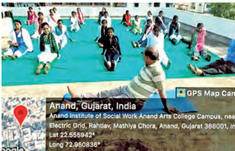
Anand, Gujarat, India Anand Institute of Social Work Anand Arts College Campus, near Electric Grid, Rahtliav, Mathiya Chora, Anand, Gujarat 388001, India Lat 22.555942* Long 72.950836*