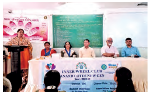
Anand, Gujarat, India Anand Institute of Social Work Anand Arts College Campus, near Electric Grid, Rahtlav, Mathiya Chora, Anand, Gujarat 388001, India Lat 22.556011° Long 72.950877°