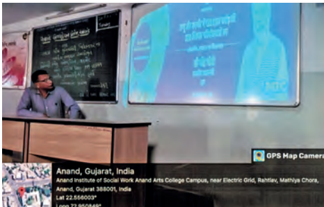
Anand, Gujarat, India Anand Institute of Social Work Anand Arts College Campus, near Electric Grid, Rahtliav, Mathiya Chora, Anand, Gujarat 388001, India Lat 22.556003* Long 72.950846*