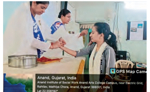
Anand, Gujarat, India Anand Institute of Social Work Anand Arts College Campus, near Electric Grid, Rahtliav, Mathiya Chora, Anand, Gujarat 388001, India Lat 22.556192*