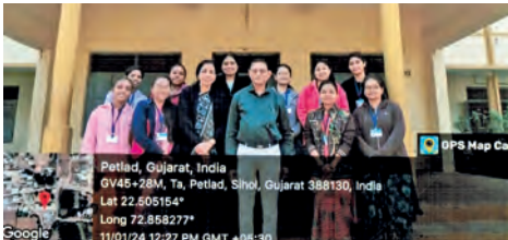
Pettlad, Gujarat, India GV45+28M, Ta, Pettlad, Sihol, Gujarat 388130, India Lat 22.605154° Long 72.858277°