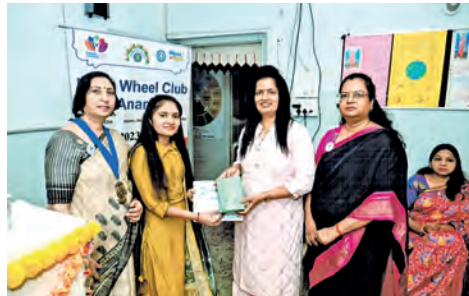
Anand, Gujarat, India Anand Institute of Social Work Anand Arts College Campus, near Electric Grid, Rahtlav, Mathiya Chora, Anand, Gujarat 388001, India Lat 22.556192° Long 72.950852°