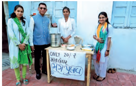
Anand, Gujarat, India Anand Institute of Social Work Anand Arts College Campus, near Electric Grid, Rahtlav, Mathiya Chora, Anand, Gujarat 388001, India Lat 22.556011° Long 72.951177°