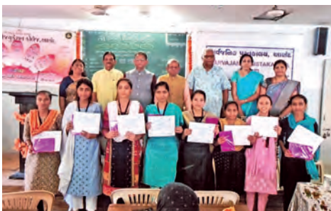
Anand, Gujarat, India Anand Institute of Social Work Anand Arts College Campus, near Electric Grid, Rahtlav, Mathiya Chora, Anand, Gujarat 388001, India Lat 22.556011° Long 72.950877°