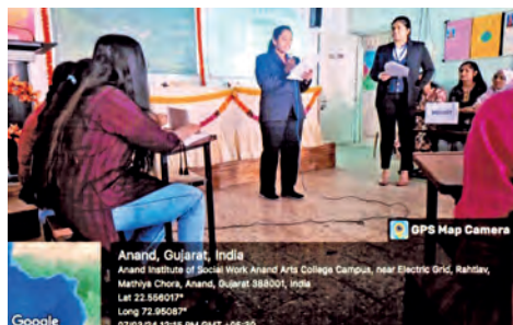
Anand, Gujarat, India Anand Institute of Social Work Anand Arts College Campus, near Electric Grid, Rahtlav, Mathiya Chora, Anand, Gujarat 388001, India Lat 22.556011° Long 72.950877°