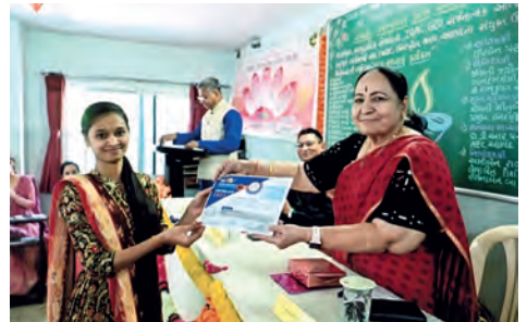
Anand, Gujarat, India Anand Institute of Social Work Anand Arts College Campus, near Electric Grid, Rahtlav, Mathiya Chora, Anand, Gujarat 388001, India Lat 22.556192° Long 72.950852°